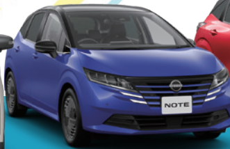
NEW NOTE ノート