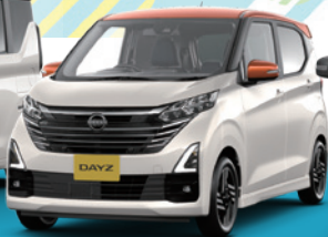
NEW DAYZ デイズ